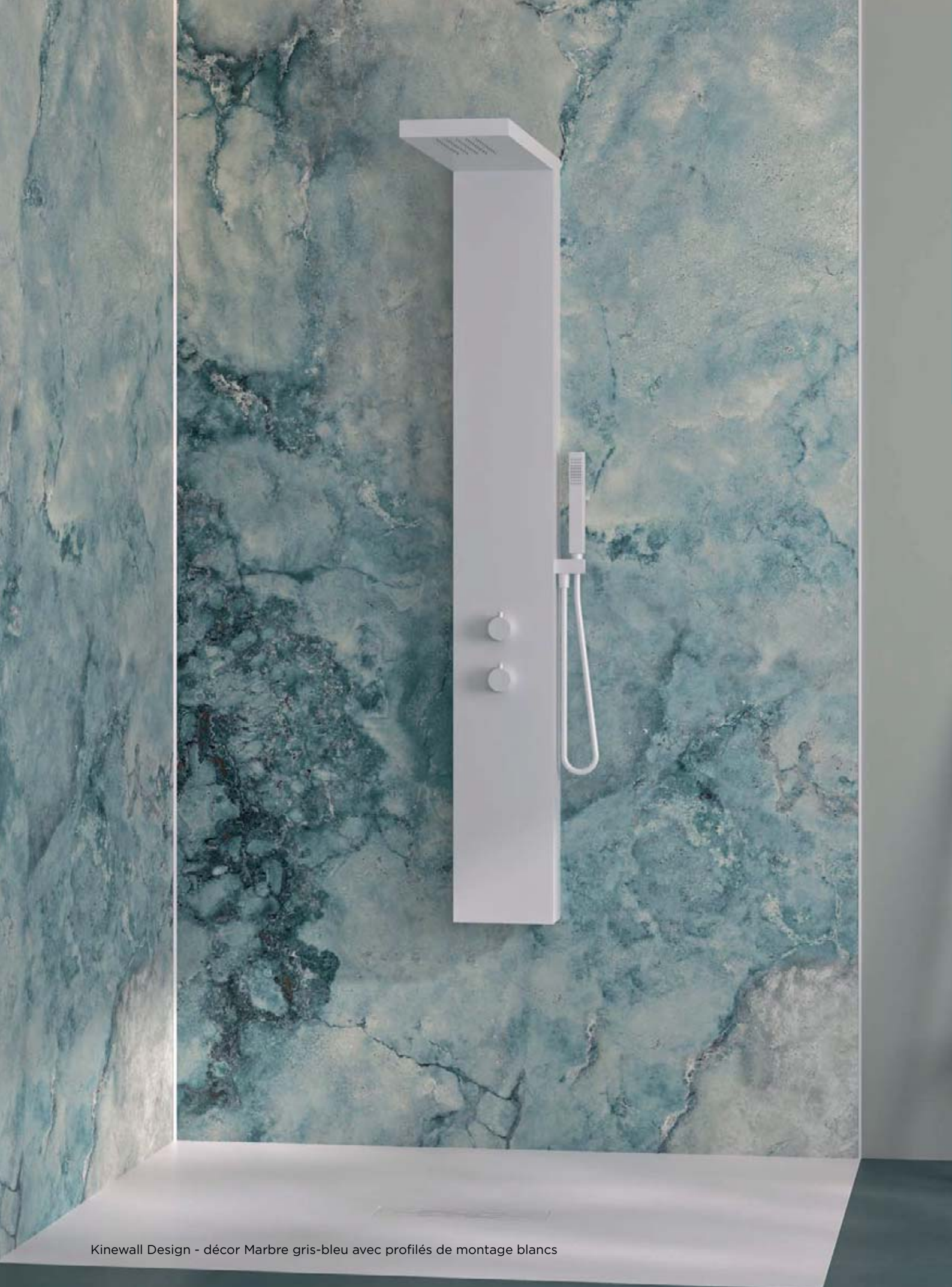
Kinewall Design - décor Marbre gris-bleu avec profilés de montage blancs